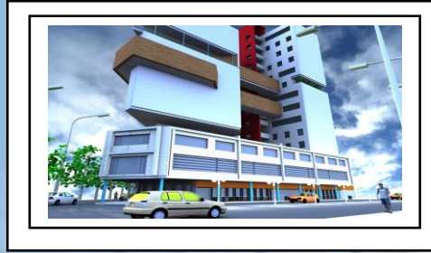
وقف البغدادي - الفوال

السوق العربي – تقاطع شارع عبد المنعم مع شارع سنكات – غرب ميدان الأمم المتحدة المساحة: 881 (متر 2 ) التكلفة الكاملة شاملة قيمة الأرض: 8,381,400 ($) التكلفة الكاملة من غير قيمة الارض: 7,059,900 ($) (التصميم ودراسة الجدوي الأولية جاهزة)