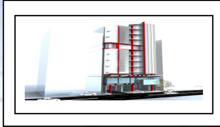
وقف البغدادي - الحلواني

السوق العربي – بين شارع الجمهورية والبرلمان- غرب شارع عبد المنعم محمد المساحة: 1.794 (متر 2 )